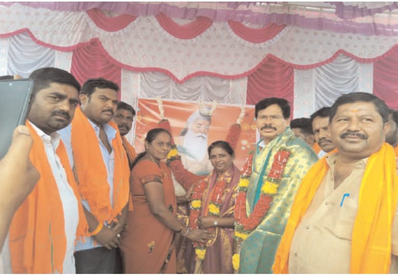
జ్ఞాన నిధిని ప్రపంచానికి చాటిన ఆదికవి కృషి పట్టుడలతో మహర్షిగా ఎదిగిన మహనీయుడు